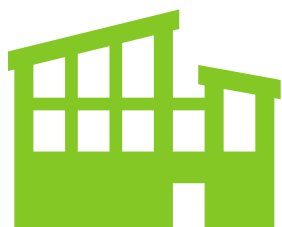
Gare de Saint Rémy-lès-Chevreuse