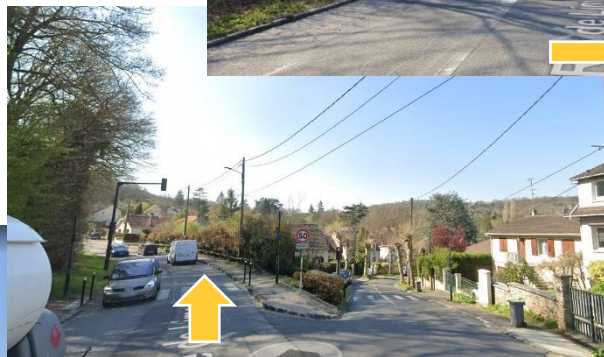
Au feu suivre « Route de Limours » tout droit en remontant