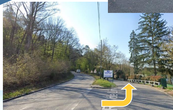
Prendre à droite à l'embranchement